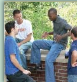
Des étudiants en pause

L'assurance santé est obligatoire pour tous les étudiants. Elle coûte entre $257 et $325 par semestre et varie en fonction du plan choisi. Sur le campus le logement coûte entre $1640 et $3100 et varie également en fonction du choix de l'étudiant. Les logements en dehors du campus s'élèvent à $600 par mois ou plus. La nourriture et les dépenses personnelles s'élèvent approximativement à $500 par mois.